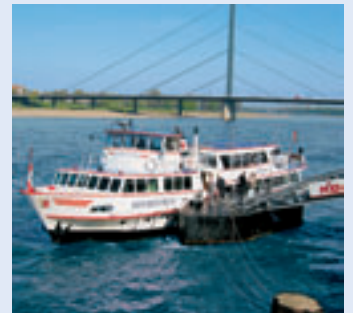
MS HEINRICH HEINE