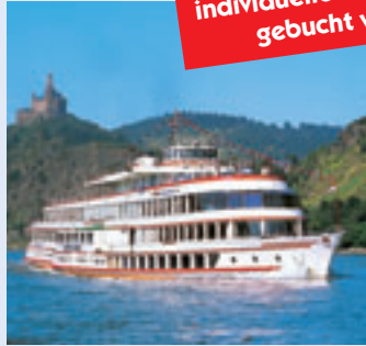
MS WAPPEN VON KÖLN