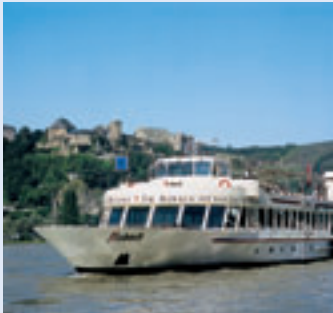
MS ASBACH, MS LORELEY

Alle Schiffe können für individuelle Charterfahrten gebucht werden!