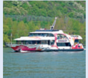
MS BUGA KOBLENZ 2011