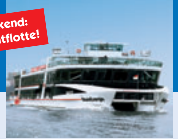
MS RheinEnergie, MS RheinFantasie